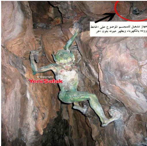
جهاز تشغيل للمجموع الموضوع على الانترنت ترووده بالکھرباھ و بظھر عورہ بلون الحجر