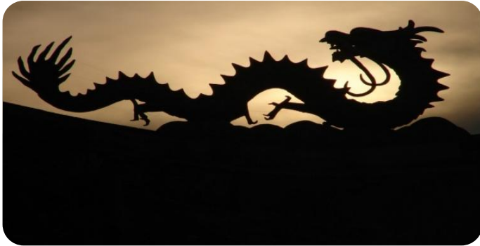
عکس پنجم اژدها

هوا که وقتی ذراتش گرد هم می آیند غلیظ می شوند و به صورت ابر در می آیند و وقتی ذرات از هم جدا می شوند لطیف می شوند و دیده نمی شوند